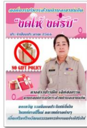
ประกาศสำนักงานตำรวจส่วนกลางเรื่อง นโยบายไม่รับของขวัญ (No Gift Policy)

ข้อย่อยที่ ๒ จัดทำสื่อประชาสัมพันธ์(Infographic) “งดรับ งดให้” ของขวัญ รวมถึงผลประโยชน์อื่นใดในเทศกาลปีใหม่ และเทศกาลต่างๆ เพื่อเสริมสร้างวัฒนธรรมการทำงานอย่างโปร่งใส