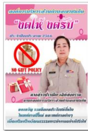
ประกาศองค์การบริหารส่วนตำบลเขาชนไก่ เรื่อง นโยบายไม่รับของขวัญ (No Gift Policy)

ข้อย่อยที่ ๑ จัดทำประกาศองค์การบริหารส่วนตำบลเขาชนไก่ เรื่อง นโยบายไม่รับของขวัญ (No Gift Policy) ณ วันที่ ๒๙ ธันวาคม ๒๕๖๕