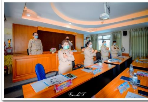
ประกาศนโยบาย No gift policy ไม่รับของขวัญ หรือ ของกำนัลทุกชนิด