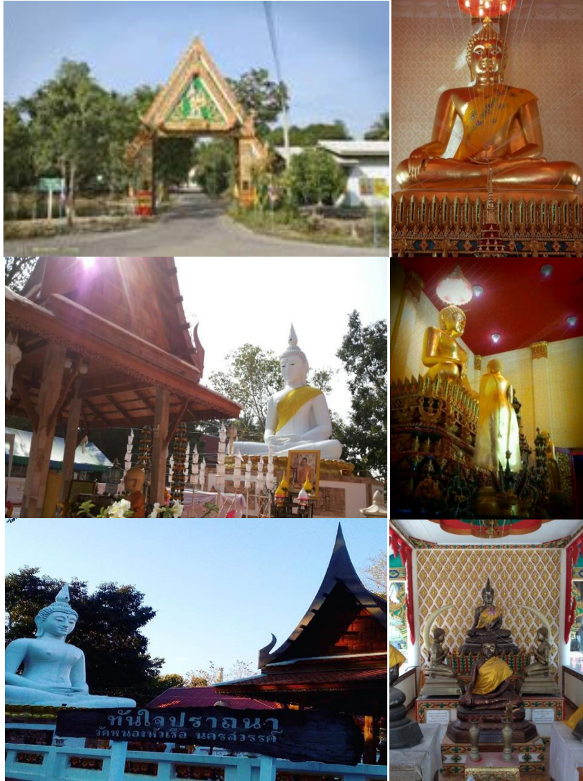
หลวงพ่พระพุทธรูปมงคล พระประธานในอุโบสถ วัดหนองหัวเรือ วัดหนองหัวเรือ - หลวงพ่อทันใจอินทร์แปลง หมู่ที่ ๔ ต.มหาโพธิ อ.เก่าเลี้ยว จ.นครสวรรค์